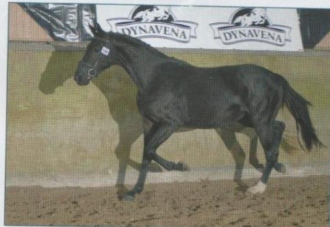
SANTANA LH (Sir Donnerhall x Natiello xx x Weltmeyer)