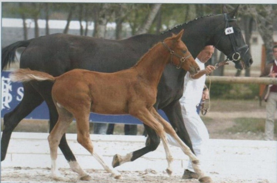
DIXIE DELIGHT LH (Don Ricoss x Warkant x Lanthan), 4e des femelles Foals à seulement 2 mois et demi - Saumur 2008 -

Pour la saison 2009, nous offrons un choix de 41 étalons de dressages, 17 étalons CSO et 3 étalons poney. 17 de ces étalons ont entre 3 et 4 ans. Dans "Les Petits Nouveaux", vous trouverez : Bentley par Belissimo M - Champion à l'approbation 2008 du Hanovre, Furstenball par Furst Heinrich - Champion à l'approbation 2008 du Oldenburg, Barclay par Belissimo M - Champion de l'épreuve de performance des étalons 2008 à Adelheidsdorf, Fiorano par Rousseau - Champion de l'épreuve de performance 2008 de Munster-Handorf.