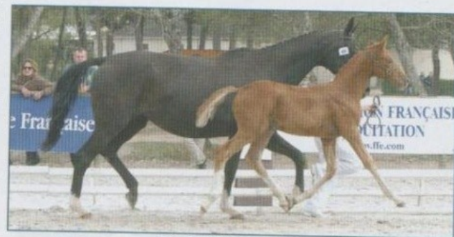
DIXIE DELIGHT LH,

poulinières (Rosentanz par Rotspon par exemple). D'autres produiront d'abord un ou 2 poulain(s) et ensuite entameront une carrière sportive (Daikiri pour ne citer qu'elle). Nous avons 3 juments primées d'état, qui ont donc montré leurs qualités lors des tests de performance en Allemagne. Nous sommes également propriétaire de la propre soeur de l'étalon Lancet (qui a participé notamment aux derniers Jeux Olympiques de Beijing). Nous avons dû attendre 3 ans avant que le précédent propriétaire de SPS Wolke Seiben n'accepte de nous la vendre, mais elle en valait la peine! Elle a produit successivement Da Vinci LH et Sir Weltmeyer LH. Dès lors, pour chaque jument, il nous suffit de sélectionner l'étalon qui saura améliorer ses qualités et non corriger ses défauts. Chaque année, nous créons des listes et des listes de combinaisons possibles, jusqu'à arriver à celle affichée sur le site Internet (et qu'il nous arrive de modifier encore avant que la jument ne soit inséminée). Mais véritablement, le plus dur du travail a déjà été fait lors de l'acquisition de nos juments! ■