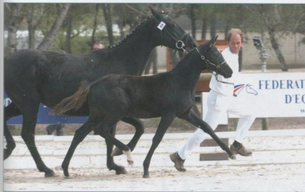
ULTIMATE DELIGHT LH (Hilken's Black Delight x Chairman x Brentano I), Championne de France des foals femelle poney - Saumur 2008

En 2007, nous avons vendu à nos mêmes clients suisses une demie part du demi frère de Da Vinci LH : Sir Weltmeyer LH. En 2008, nous avons également vendu une part de Sergio LH (Sir Donnerhall et Rostpon) à une cliente qui est déjà propriétaire de 2 de nos poulains 2007. Sergio LH a été déclaré